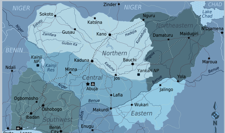
BOKO HARAM ÖRGÜTÜ NİJERYA'NIN KUZAY BÖLGELERİNDE KONTROLÜ ELİNDE TUTUYOR

En son el-Cezire TV'ye görüntülü bir açıklama yapan Boko Haram'ın lideri Muhammed Şiko, hükümet güçlerinin hem Müslümanları hem de Hristiyan sivilleri öldürdüğünü, sonra da suçu kendi üzerlerine attığını iddia etmiş, kendilerinin hiçbir masumun kanına girmediklerini, hiçbir kimseye zulmetmediklerini ifade etmiştir.